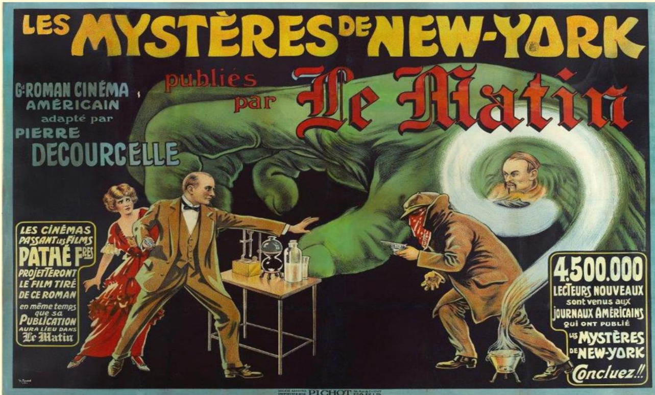
Les mystères de New York, 1915, Charles Tichon, 200 x 240 cm

Le Mucem propose une exposition intitulée Roman-Photo du 13 décembre 2017 au 23 avril 2018