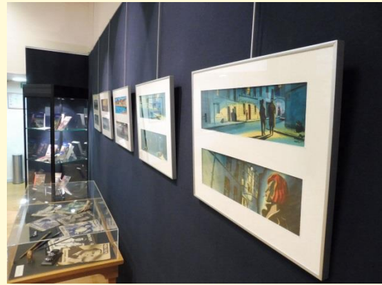
Exposition Simonon-Loustal à la BiLiPo