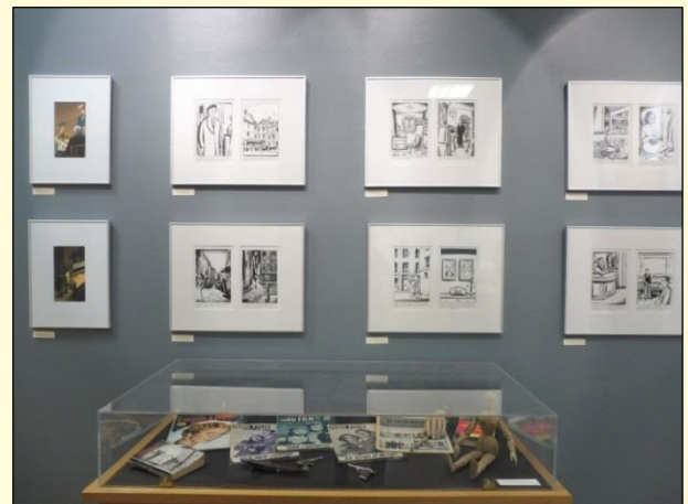
Photos de l'exposition Simenon-Loustal à la BiLiPo

Agatha Christie au musée du Louvre en mai