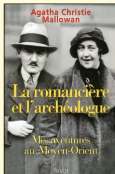
La romancière et l'archéologue : mes aventures au Moyen-Orient / Agatha Christie Payot & Rivages, 2005