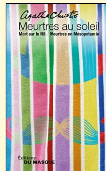
Meurtres au soleil : Mort sur le Nil : suivi de Meurtre en Mésopotamie / Agatha Christie, Éditions du Masque, 2015